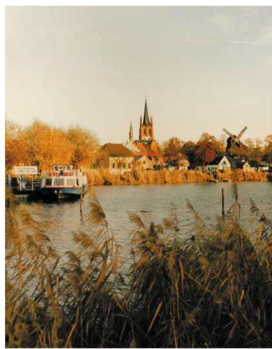
Die Stadt ist seit Jahrzehnten ein beliebtes Ausflugsziel für Berliner.

Wir alle sehnen uns doch danach, dass jemand würdigt, was wir tun – dass wir gesehen werden.